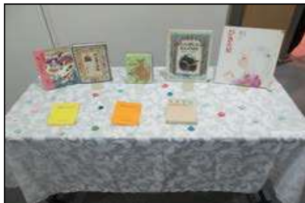
3月『大人のためのストーリーテリング』