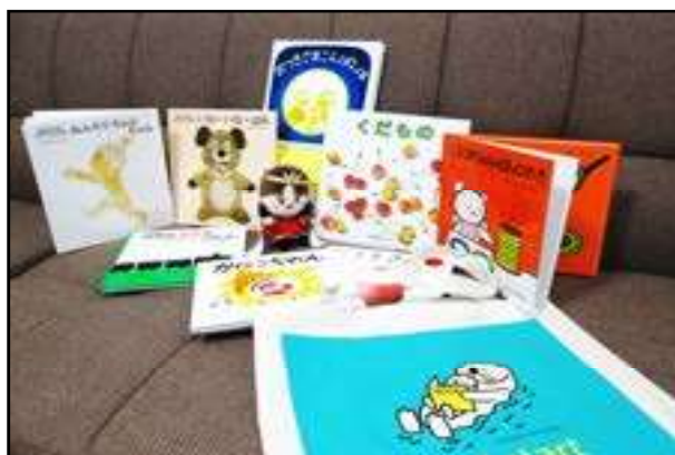
『ブックスタートパック』