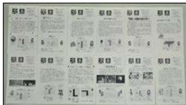
①図書館広報誌「文車」特集