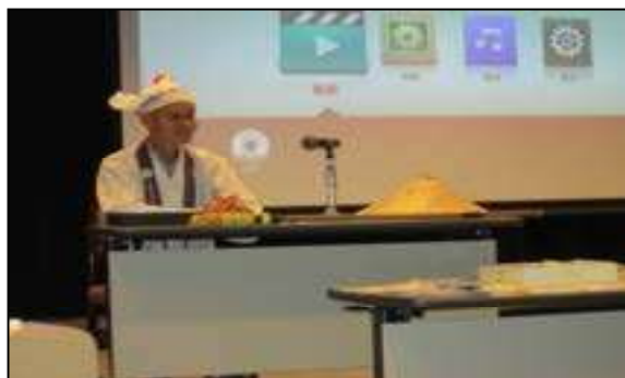
10月『四国八十八ヶ所講演会』