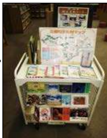
下段① 「三郷町ゆかりの作家」による資料