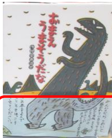
令和3年 本の帯応募作品

さて、コロナの分類が5類に移行し、制限が解除されたことで、図書館ではイベントを再開しており、「本の帯コンテスト」もその一つです。現在、「本の帯コンテスト」の作品募集中です。小学生のみなさんが楽しんで読まれた本の中から、おすすめしたい本の「本の帯」を作製してはいかがでしょうか。提出の締め切りは9月10日（日）ですので、まだまだ間に合います。みなさんの作品をお待ちしております。