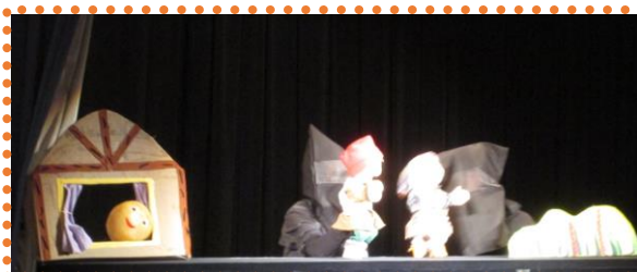
人形劇：まんまるパン