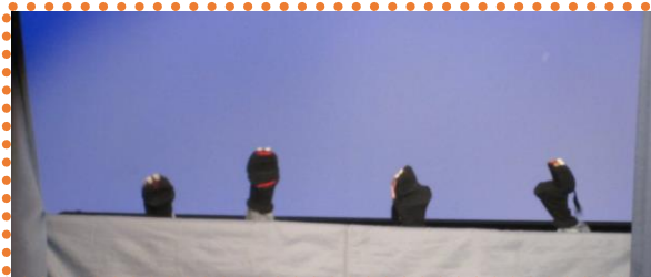
オープニング：おたまじゃくし