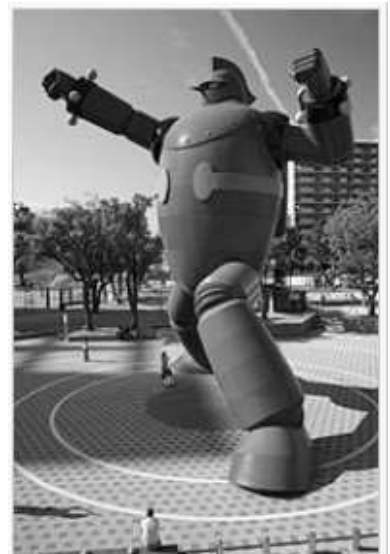
新長田・若松公園の鉄人28号モニュメント